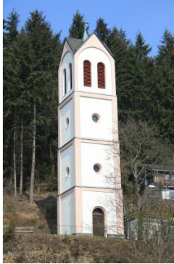
Glockenturm – An der Hardt