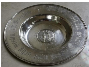
Taufschale von 1877

Sie sehen, dass Sie die Arbeit des Fördervereins durch Ihre Mitgliedschaft, durch Spenden oder durch Beteiligung an unseren einzelnen Vorhaben unterstützen können.