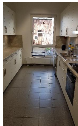
Küche im Gemeindehaus