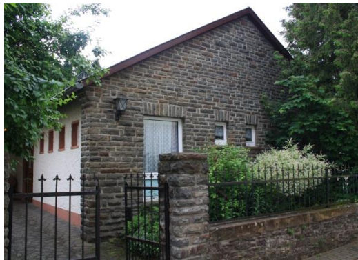
Gemeindehaus – Im Kirschseiffen 24