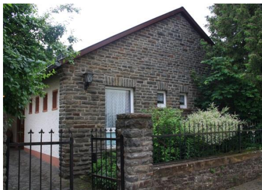
Gemeindehaus – Im Kirschseiffen 24