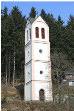
Glockenturm – An der Hardt